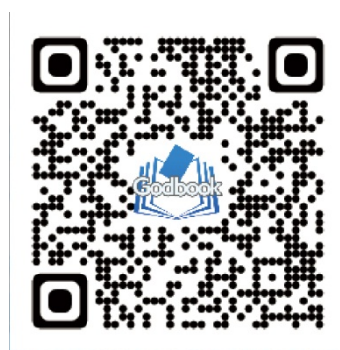
▲事前登録はコチラから

事前登録数に応じて、初回ダウンロード時にアイテムを全ユーザーにプレゼントを予定しています