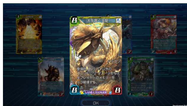
▲パックには7枚のカードがランダムで封入されています