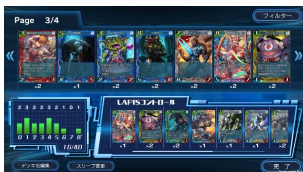
▲180種類のカードの中から40枚を選びデッキを構築

現在、スマートフォンやタブレット端末の普及、SNSの発達など、おもちゃのあり方、遊び方にも大きな変化が生まれてきております。「WAR OF BRAINS」は、アナログカードゲームの魅力である「対人戦の駆け引き」をデジタル化することで、時代の変化に対応し、「新しい遊びの価値」を提供してまいります。